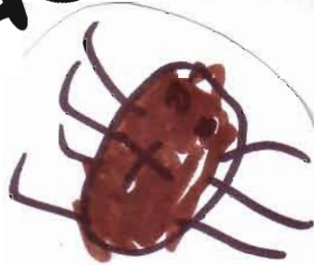
spinnen van isis