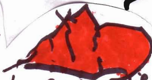
herfst blaadje ruben